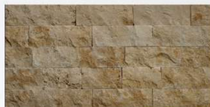
Classic 10 x Serbest Boy Travertine