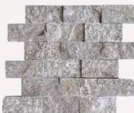
Silver - 2" x 4" (50 x 100 mm) Travertine