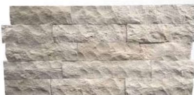
Classic 10 x 300 mm Travertine