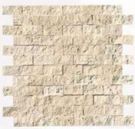
Classic - 1" x 2" (25 x 50 mm) Travertine