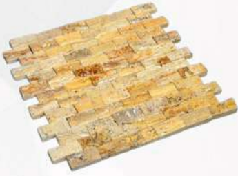
Yellow - 1" x 2" (25 x 50 mm) Travertine