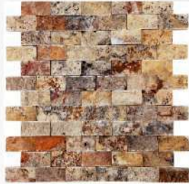
Scabos - 1" x 2" (25 x 50 mm) Travertine