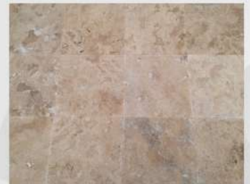
Light Travertine Commercial