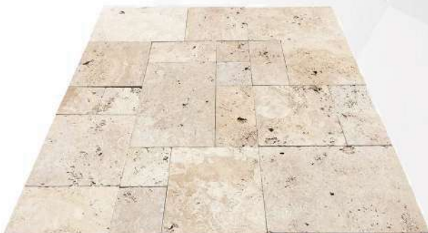
Commercial (ECO) Travertine French Pattern (Tumbled)