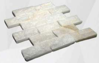
Muğla White - 2" x 4" (50 x 100 mm) Travertine