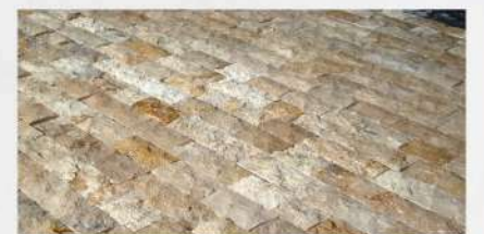
Classic 7,5 x Serbest Boy Travertine