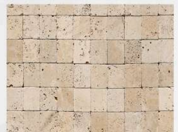
Light Travertine Commercial (1x10x10)