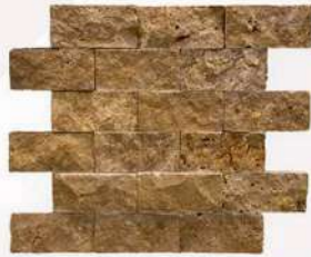
Noche - 2" x 4" (50 x 100 mm) Travertine