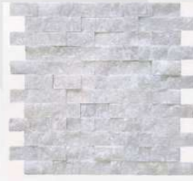
Muğla White - 1" x 2" (25 x 50 mm) Marble