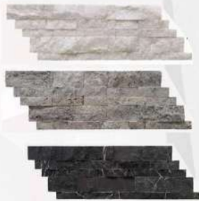
Muğla White Marble