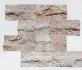
Classic 75 x 150 mm Travertine