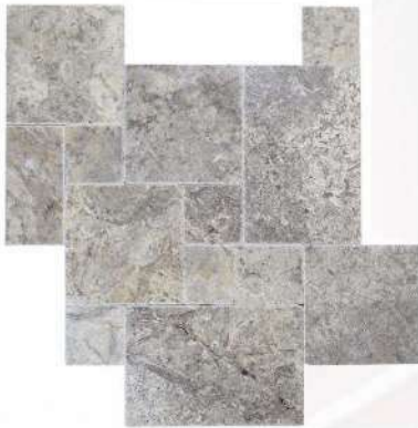
Silver Travertine French Pattern (Tumbled)