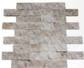
Classic 50 x 200 mm Travertine