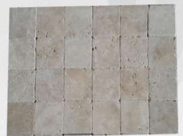
Light Travertine (Tumbled) (1x10x10)