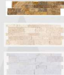
Ledger Panel Scabos Travertine