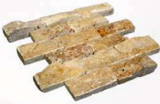
Scabos - 2" x 4" (50 x 100 mm) Travertine