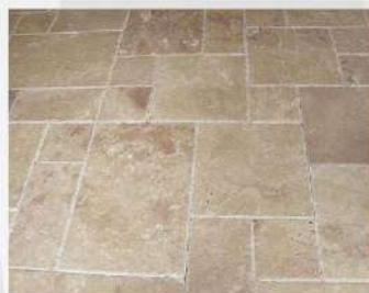
Light Travertine French Pattern (Tumbled)