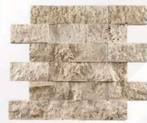
Classic - 2" x 4" (50 x 100 mm) Travertine