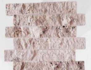
Classic 50 x 150 mm Travertine