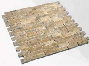
Noche - 1" x 2" (25 x 50 mm) Travertine