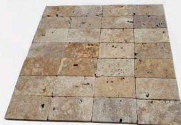
Travertine Commercial Power (15,2x30,5)