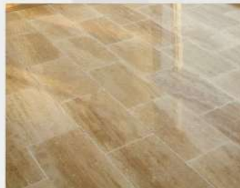
Light Travertine (2x30x60)