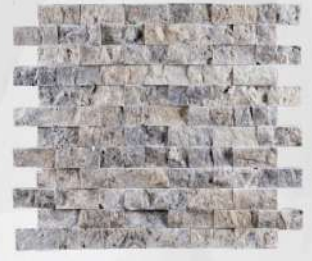
Silver - 1" x 2" (25 x 50 mm) Travertine