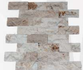
Classic 75 x 200 mm Travertine