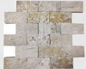
Rustik - 2" x 4" (50 x 100 mm) Travertine