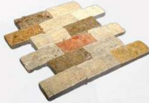
Mix - 2" x 4" (50 x 100 mm) Travertine